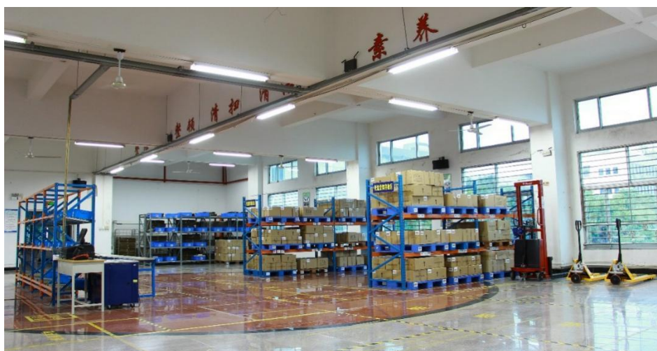
现代物流实训实训中心主要设施设备和功能见下表

物流综合实训室配置的现代物流实验项目应用现代信息技术的管理方法，采用物流的网络化运作，通过对企业物流仓储作业、配送作业和运输作业进行整体的模拟；依照物流管理职业能力培养的要求，培养学生物流市场拓展、运输调度、仓储与配送管理、ERP 软件应用等技能，本专业的实训设备和实训场地基本能够满足实践教学计划基本要求，并已制定完善的实践教学管理措施，保障实训基地的顺利运行。同时，本专业在建设过程中与企业紧密结合，校企双方共建生产性实训基地。